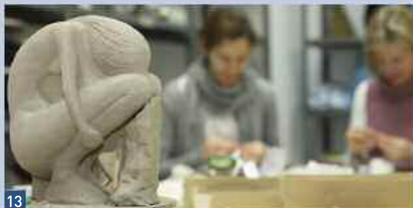
Oferta educativa en la ciudad