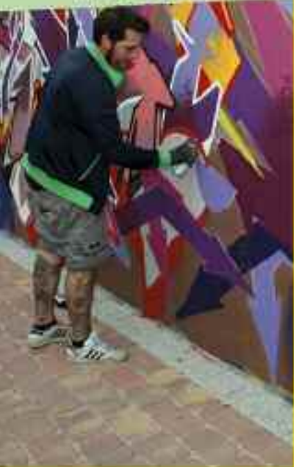
El sábado 10 de septiembre los aficionados a la cultura urbana tienen una cita en el complejo de campos de fútbol

bol "La Aldehuela" con la IV Edición del Festival Internacional de Hip Hop y Cultura Urbana "Street Dreams Festival". Desde las 12:00 h. los asistentes podrán disfrutar de un amplio programa de actividades para todos los públicos.